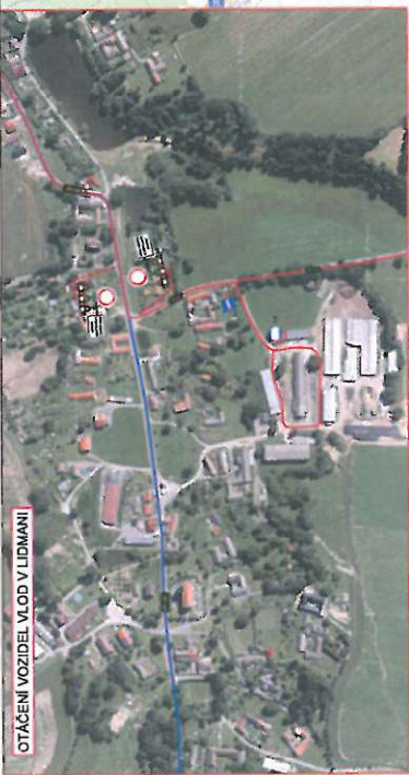
OTÁČENÍ VOZIDEL VLOD V LIDMAŇI

LEGENDA (situace) PŘECHODNÉ DOPRAVNÍ ZNAČENÍ STÁVNÍ DOPRAVNÍ ZNAČENÍ STÁVNÍ DOPRAVNÍ ZNAČENÍ - DOČASNĚ ZNĚPLATNĚNÉ 1) Všechná dopravní značení bude realizována v souladu s TŘ.Č.68 2) Stávající dopravní značení v rozporu se zveřejněným bude zrušeno, zneplatněno